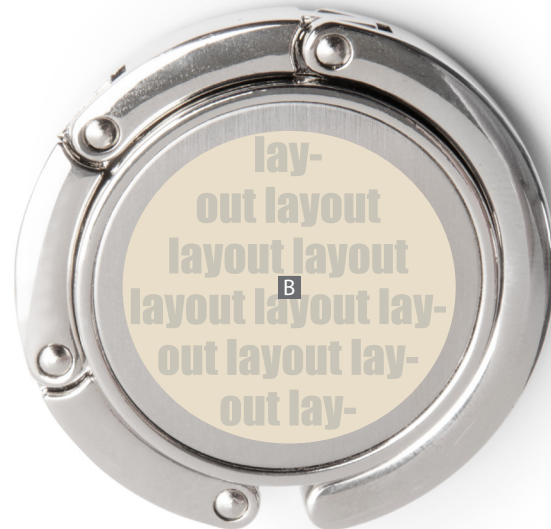
Diagram niet op schaal